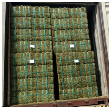
2 x 2 plots